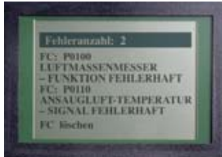
OBD – cod-P0: relevant gazelor de evacuare Fiecare producător de vehicule utilizează același cod de eroare pentru piesa respectivă.

Cu macs 40 intrați avantajos și fără riscuri în lumea diagnozei moderne. Gutmann vă oferă posibilitatea de a efectua rapid și ușor o diagnoză.