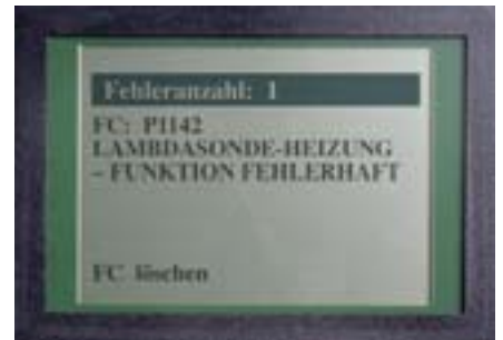
OBD – cod-P1: specific producătorului Fiecare producător poate selecta codurile de erori proprii.