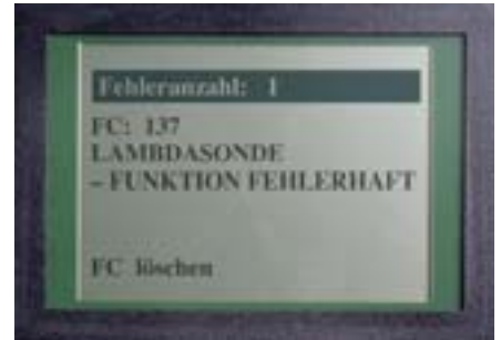
Citire / ștergere coduri eroare: MOTOR la fiecare vehicul cu mufa-CARB (16 poli) (de ex. VW:95- / Opel 96- / Ford: 97- / etc.)