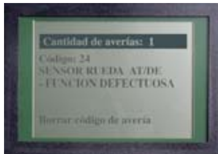
Citire / ștergere coduri eroare: ABS La fiecare vehicul cu mufa-CARB (16 poli).